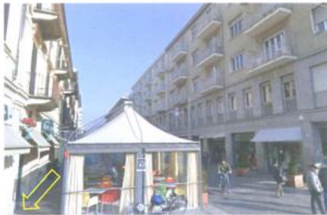
Indicazione posizione console deejay