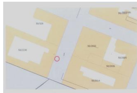
Indicazione planimetrica posizione console deejay

DATO ATTO che i ricettori residenziali prossimi al locale risultano ubicati: