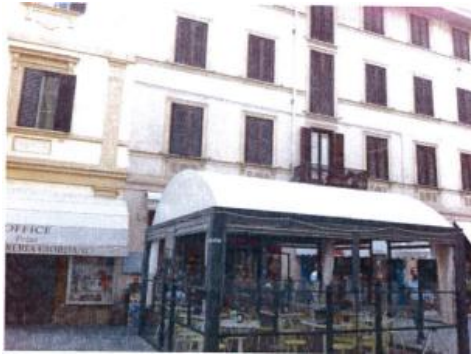
Vista del dehor esterno