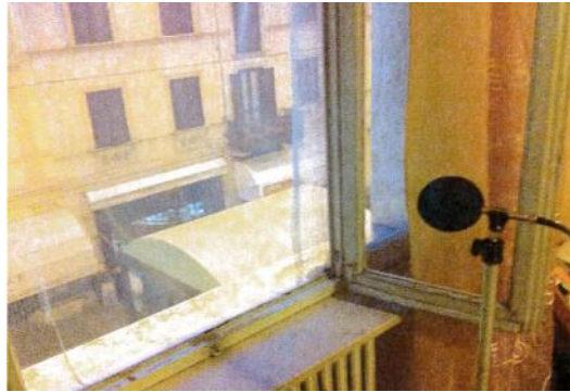
Ricettore B) posizione di misura presso camera da letto dell'unità abitativa posta al secondo piano edificio ubicato di fronte al Bar Jamaica sul fronte opposto di Corso Garibaldi.

PRESO ATTO della strumentazione e metodologia di misura adottate;