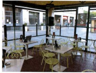
Vista del dehor con visibile la sorgente destra